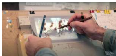
atelier Thomas Baudré