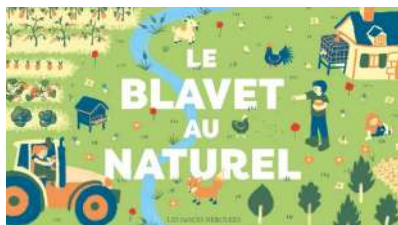
Vallée du Blavet

Infos 02 97 60 99 28 lesjardinsdewen@orange.fr ; www.lesjardinsdewen.fr