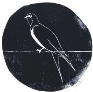
atelier Juliette Gautier