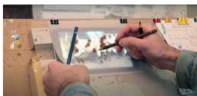
atelier Thomas Baudré