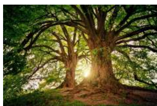
Libre de droit