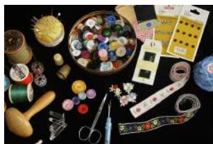
Libre de droit