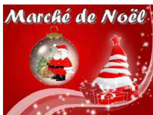
Libre de droit