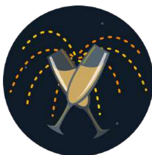
Libre de droit

Infos 02 97 60 49 06 culture@cmc.bzh ; www.centremorbihanculture.bzh