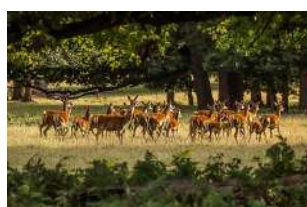
Libre de droit