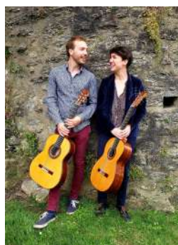
© Charlie Richardson-Smith / Anne-Lise VaumoronLe

Infos 02 97 51 15 14 ; www.lecartonvoyageur.fr