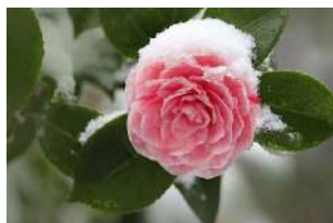
Libre de droit